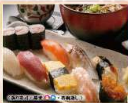
特選ランチ寿司セット

蕎麦 ★ 又は うどん ★ 2,000円(税抜) 2,200円(税込) 単品 味噌汁付き 1,800円(税抜) 1,980円(税込)