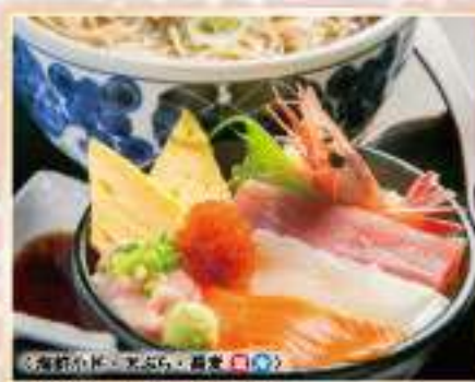
福の華ちらしセット

蕎麦 ★ 又は うどん ★ 2,000円(税抜) 2,200円(税込) 単品 味噌汁付き 1,800円(税抜) 1,980円(税込)