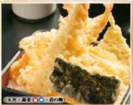
海鮮はなやぎ天重セット

蕎麦 ★ 又は うどん ★ 1,145円(税抜) 1,260円(税込) 単品 味噌汁付き 945円(税抜) 1,040円(税込)