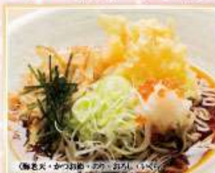
海老天おろし蕎麦