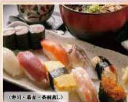
〈赤司、蕎麦、茶碗蒸し〉