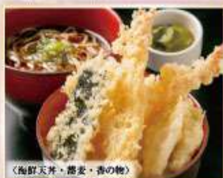
〈海鮮天丼、蕎麦、香の物〉