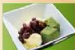
和風クリームぜんざい 400円(税込)