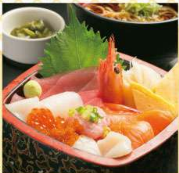
① 特上海鮮重セット