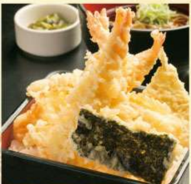
③ 海鮮はなやぎ天重セット