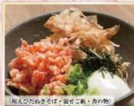
〈桜えびたぬきそば、混ぜご飯、香の物〉