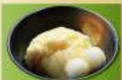
バニラ白玉みたらしソース 360円(税込)