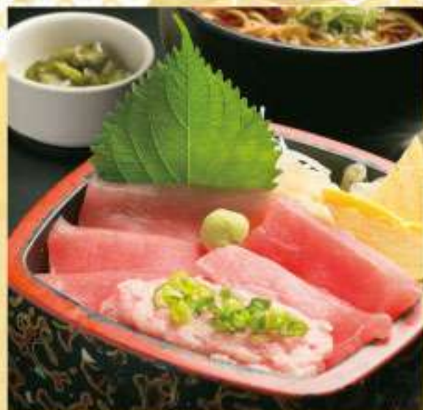
② 鉄火ねぎとろ重セット