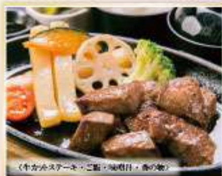
〈牛カツステーキ、ご飯、味噌汁、香の物〉