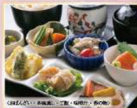
〈おぼんざい、茶碗蒸し、ご飯、味噌汁、香の物〉

1,380円(税込) 単品 1,280円(税込) 1,518円(税込) 1,408円(税込)