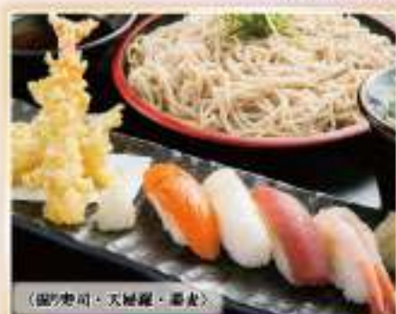
〈揚げ天司、天婦羅、蕎麦〉

980円(税込) 単品 850円(税込) 1,078円(税込) 935円(税込)