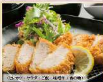
〈ヒレカツ、サラダ、ご飯、味噌汁、香の物〉