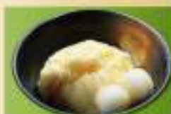
バニラ白玉みたらしソース 360円(税込)