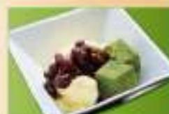
和風クリームぜんざい 400円(税込)