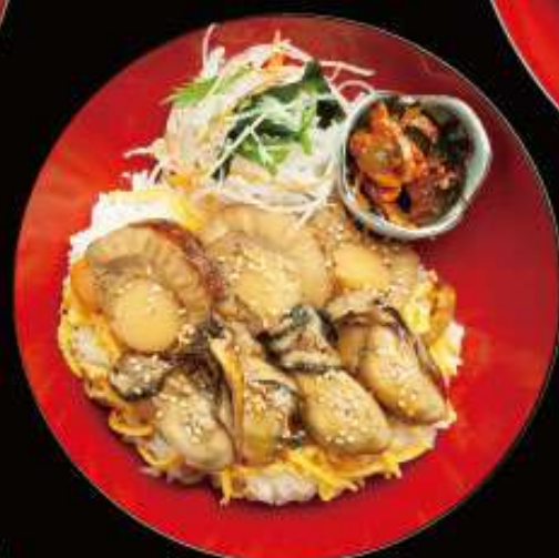
牡蠣帆立時雨煮丼