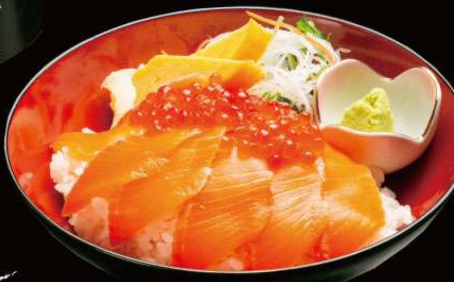
サーモンいくら丼 2,380円 (税込)