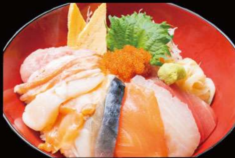
海鮮丼 1,780円 (税込)