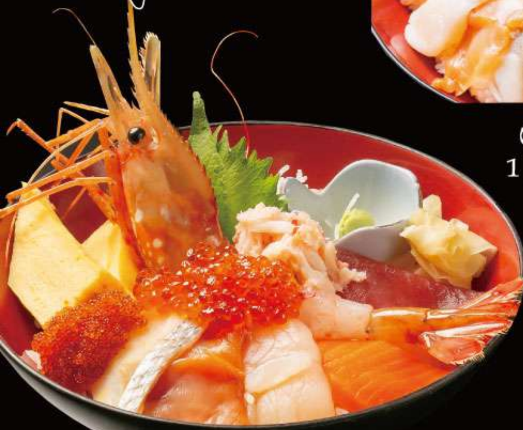
特上海鮮丼 3,780円 (税込)